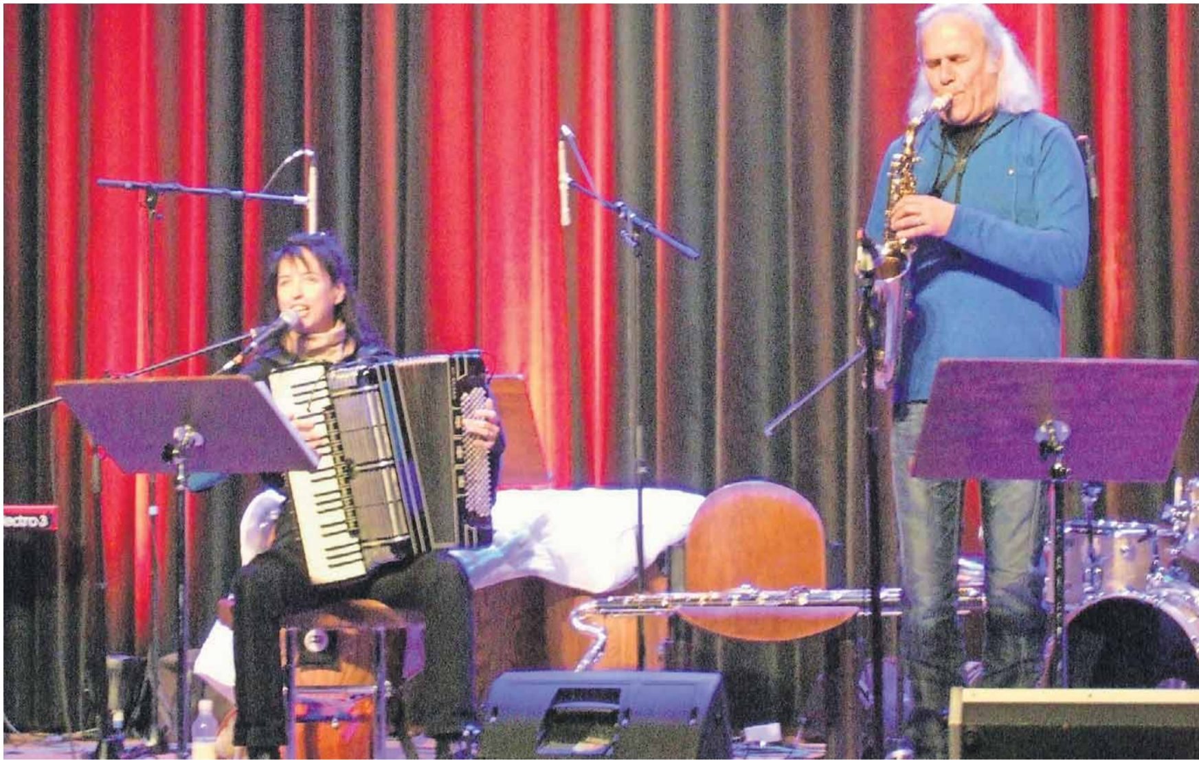
Das Haar wird schütter, das Feuer ist geblieben.