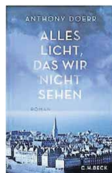
Anthony Doerr Alles Licht, das wir nicht sehen. Beck, 519 Seiten. 30.50 Fr.

Autor Anthony Doerr erzählt die Leben der beiden Protagonisten über mehrere Jahrzehnte